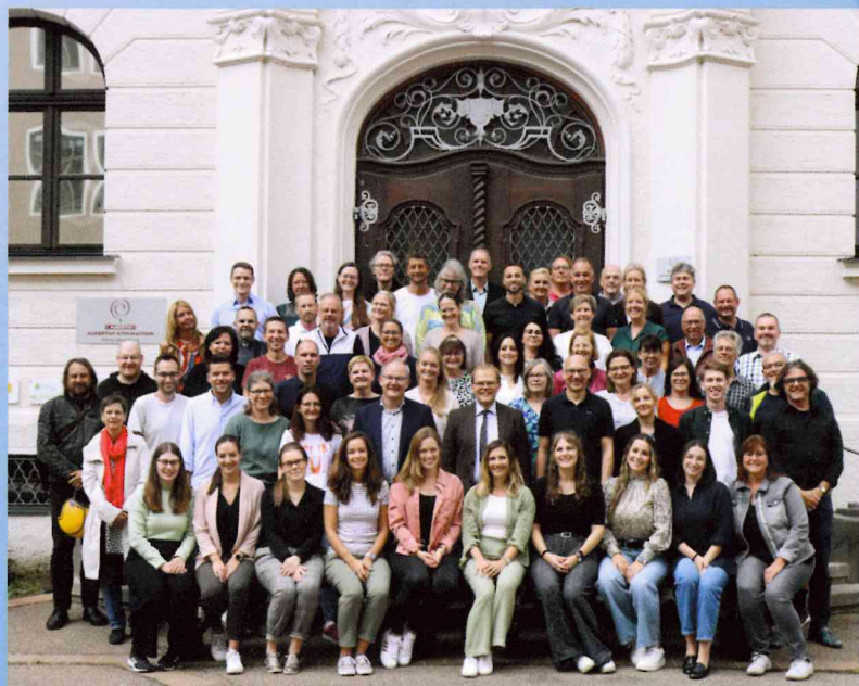
Das Lehrerkollegium 2024/25